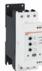
Softstart - wersja zaawansowana ADXNP Asynchroniczny trójfazowy